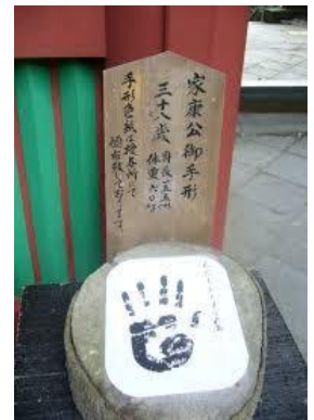
△家康公30歳時の手形