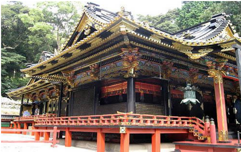
△国宝 久能山東照宮 御社殿

徳川家康公を祀る霊廟として元和3年(1617)に創建されました。権現造、総漆塗、極彩色の御社殿は江戸初期の代表的建造物として平成22年12月に国宝に指定されています。260年間続く江戸幕府の初代将軍で天下人となられた家康公は、晩年を現在の静岡市「駿府」で過ごされ、ご遺命によってここ久能山に祀られていると伝えられています。