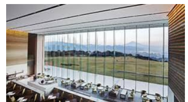
△日本平ホテルでのランチもオススメ！ ※要予約