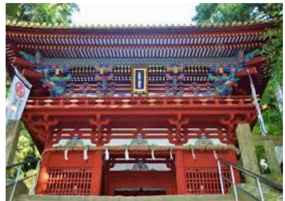
△「楼門」は俗世界と神域を区切る境界線