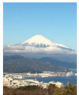
△展望台から見える富士山・清水港